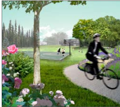
Park og bebyggelse