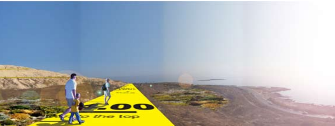
Udsigt over havet fra stien