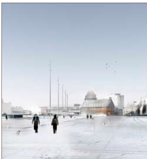
Havnepladsen en vinterdag