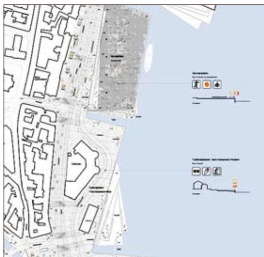
Plan Toldbod Plads og Havnepladsen