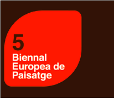
Vinder af ROSA BARBA EUROPEAN LANDSCAPE PRIZE 2008