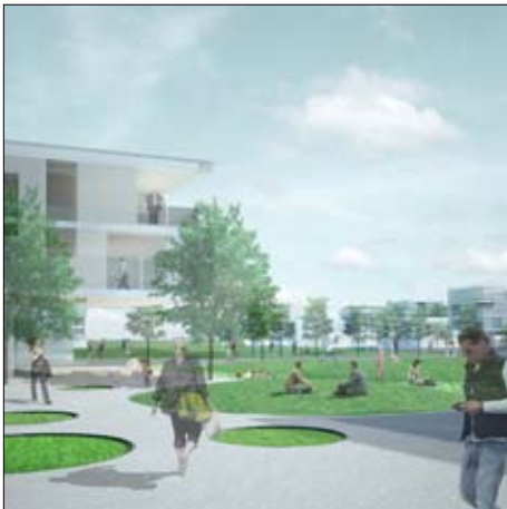
Perspektiv Finsens Fælled