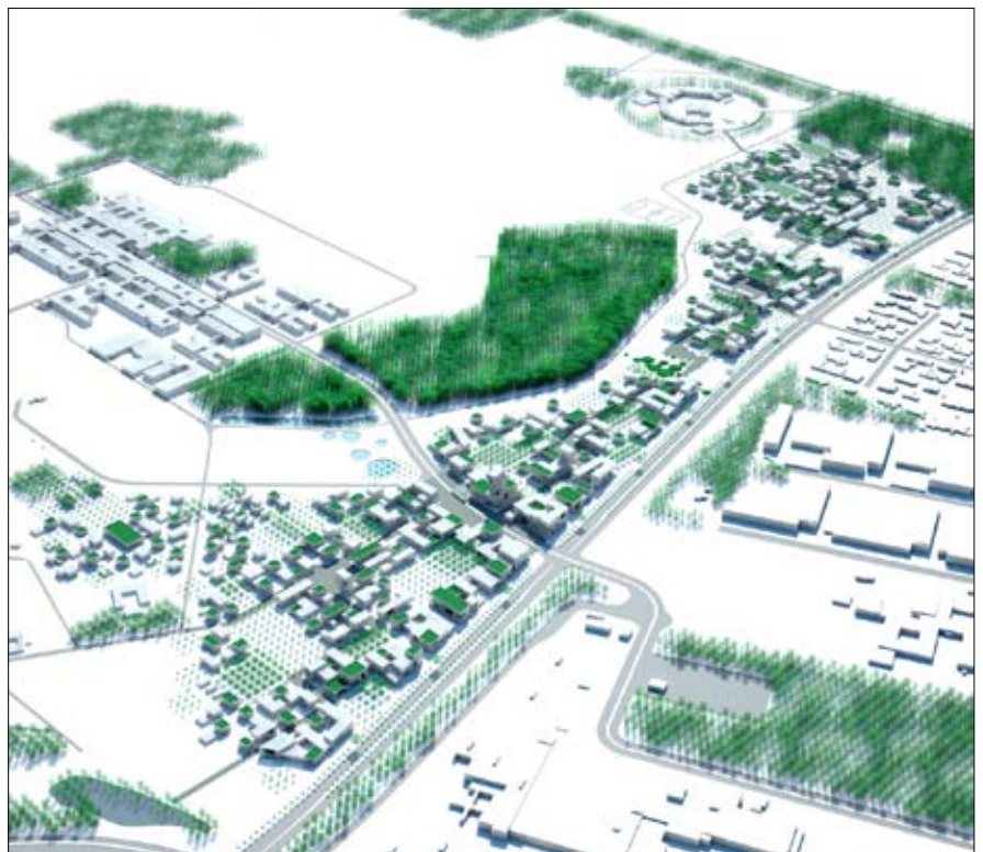
Fugleperspektiv af området