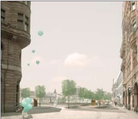
Om dagen har pladsen en særlig nordisk tone - åben, lys og venlig.