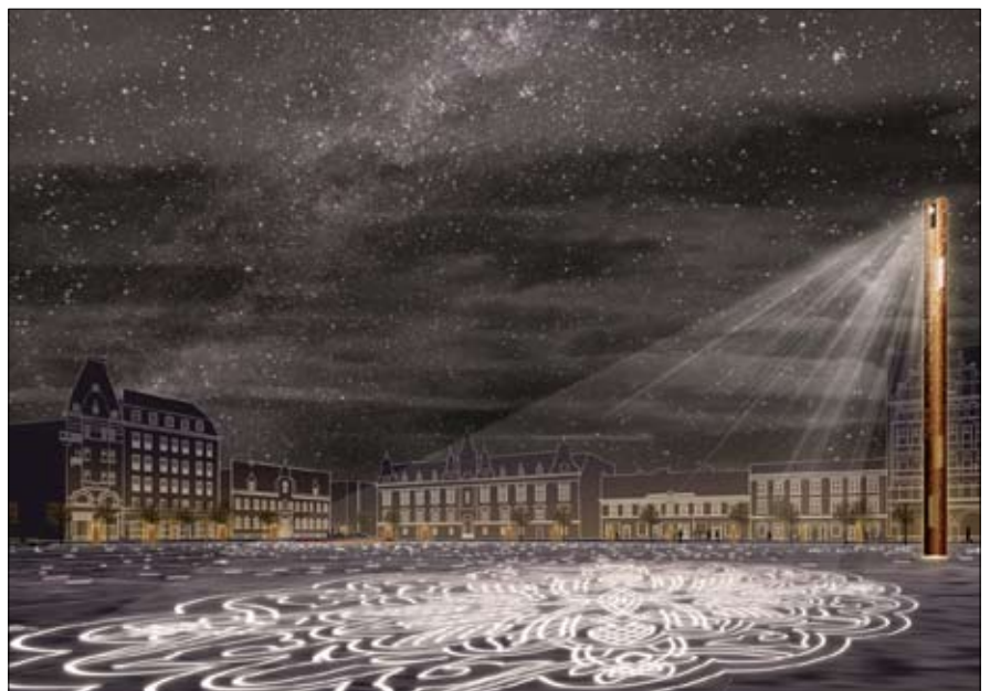
Når det skumrer bliver intensiteten - varm, dyb og gylden, der vibrerer magisk. Lyset fra skærme, lyssøjle og gulv glimter som et flyvende tæppe - som et Tusind og Et Torv!