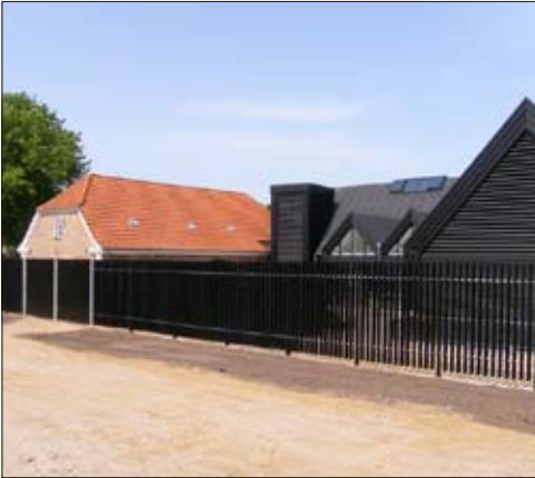
Struer Museum - 1. etape udført - hegning